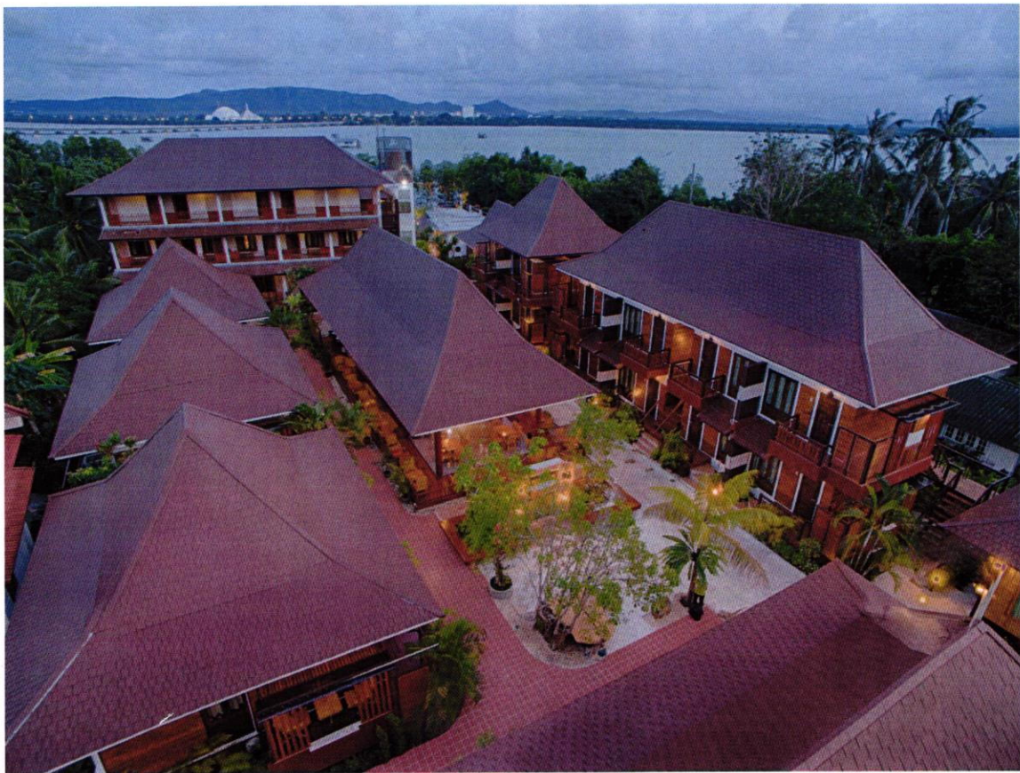
โรงแรมคุ้มไทรงาม แอนด์ รีสอร์ท