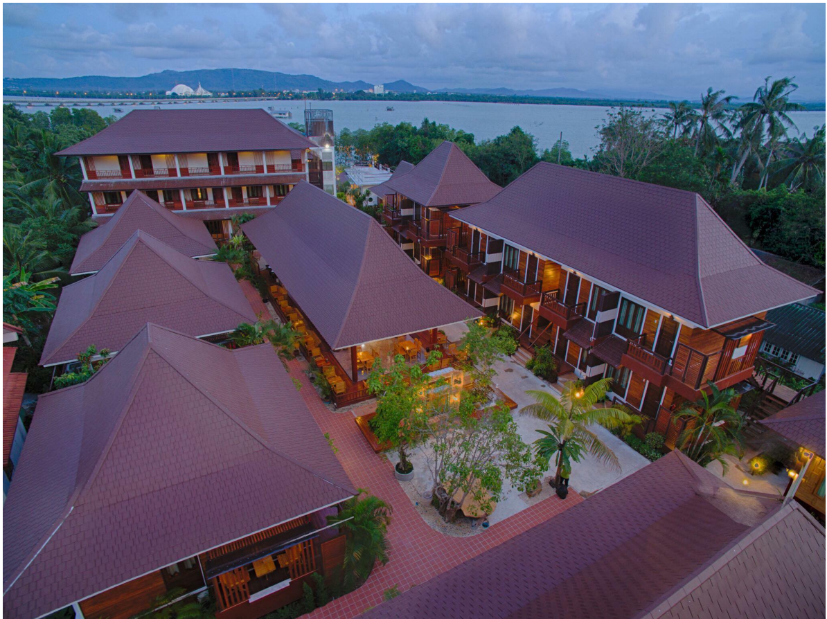
โรงแรมคุ้มไทรงาม แอนด์ รีสอร์ท