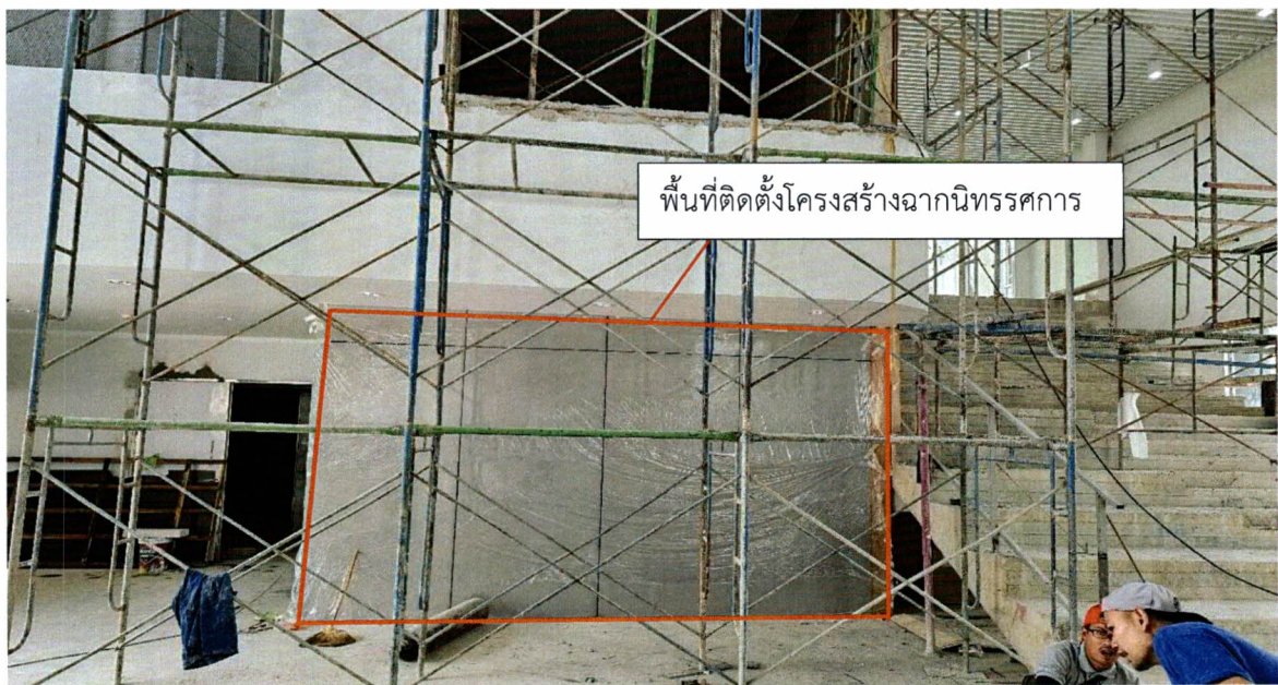
ภาพที่ 3 พื้นที่ติดตั้งโครงสร้างฉากนิทรรศการ