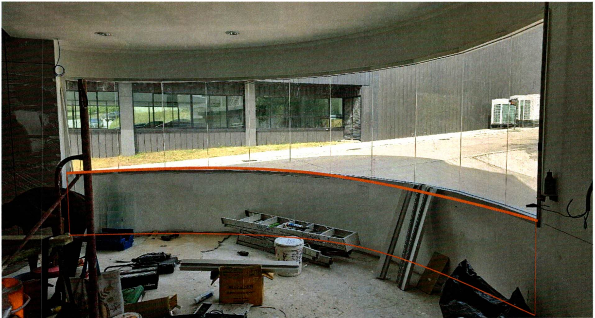
ภาพที่ 1 ตำแหน่งในการติดตั้งโต๊ะโค้งสำหรับวางชิ้นงานขนาดเล็กที่

(ลงชื่อ) ภคัท ประธานกร ประธานกรรมการ (นายภควัต ประสิทธิ์)