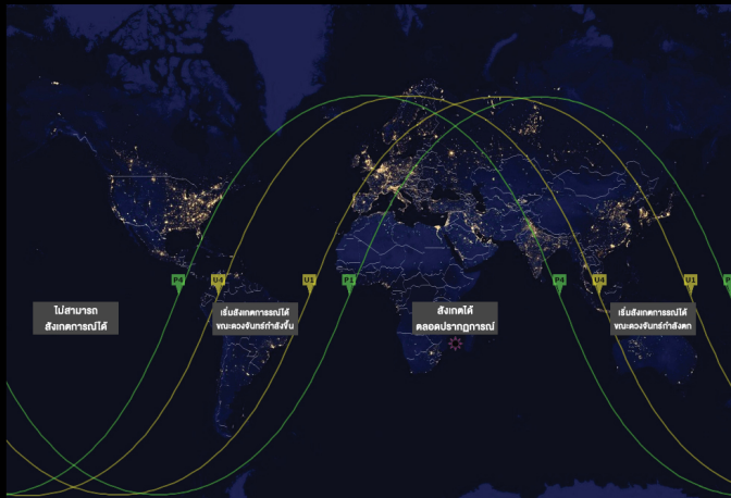
พื้นที่ต่าง ๆ บนโลกที่สามารถสังเกตเห็นปรากฏการณ์จันทรุปราคาบางส่วน วันที่ 17 กรกฎาคม 2562