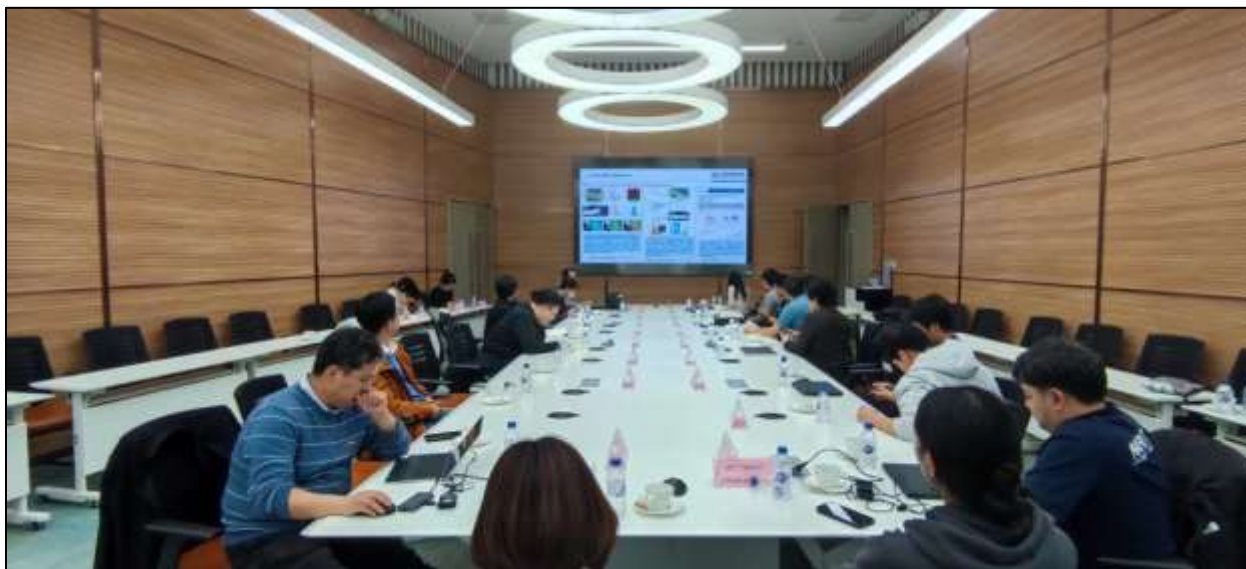
รูปที่ 2. การประชุมหารือเพื่อการแลกเปลี่ยนเทคโนโลยีระหว่างนักวิจัย CIOMP และ สดร.

ผู้แทน สดร. ทหารเรือประเด็นแนวทางการพัฒนาดาวเทียมภายใต้โครงการ TSC ร่วมกันต่อไปในอนาคตโดย สดร. ได้นำเสนอการพัฒนาเทคโนโลยีของสถาบันเพื่อขยายความร่วมมือในด้านอื่นๆ ต่อไปในอนาคต อาทิ ศูนย์วิจัยและพัฒนาเทคโนโลยีทัศนศาสตร์ ห้องปฏิบัติการขึ้นรูปชิ้นงานความละเอียดสูงและห้องปฏิบัติการเทคโนโลยีเมคคาทรอนิกส์ ดังแสดงในรูปที่ 2