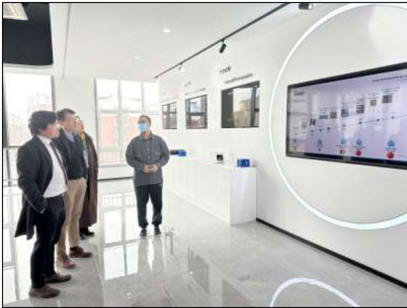
รูปที่ 3. คณะผู้แทน สดร. เยี่ยมชม บ. Spin-off ณ Optoelectronic Information Industry Park ภายใต้การบริหารของ CIOMP

ภายใต้โครงการความร่วมมือด้านเทคโนโลยีอวกาศจีน-ไทย คณะผู้บริหารและวิศวกรวิจัยจาก CIOMP มีกำหนดการเยี่ยมชมการพัฒนาเทคโนโลยีภายใต้การดำเนินการของ สดร. ช่วงระหว่างวันที่ 15-17 พฤษภาคม พ.ศ. 2566 เพื่อกระชับความร่วมมือเชิงวิจัย ต่อยอดองค์ความรู้ด้านวิทยาศาสตร์และเทคโนโลยีอื่นๆ ในอนาคต